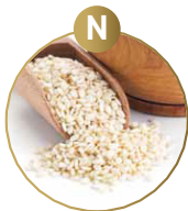
N SESAMSAMEN UND DARAUS GEWONNENE ERZEUGNISSE