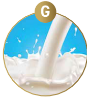
G MILCH VON SÄUGETIEREN UND DARAUS GEWONNENE ERZEUGNISSE