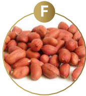
F SOJABOHNEN UND MILCHER- ZEUGNISSE (INKLUSIVE LAKTOSE)