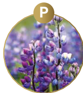
P LUPINEN UND DARAUS GEWONNENE ERZEUGNISSE