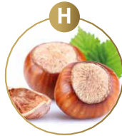
H SCHALENFRÜCHTE UND DARAUS GEWONNENE ERZEUGNISSE