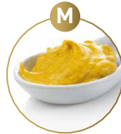
M SENF UND DARAUS GEWONNENE ERZEUGNISSE