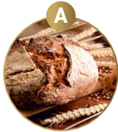
A GLUTENHALTIGES GE- TREIDE UND DARAUS GEWONNENE ERZEUGNISSE