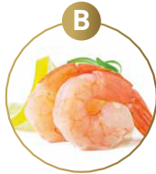
B KREBSTIERE UND DARAUS GEWONNENE ERZEUGNISSE