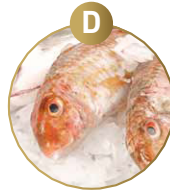
D FISCH UND DARAUS GEWONNENE ERZEUGNISSE (AUSSER FISCHGELANTINE)