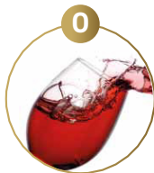
O SCHWEFELDIOXID UND SULFITE