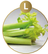
L SELLERIE UND DARAUS GEWONNENE ERZEUGNISSE