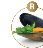
R WEICHTIERE WIE SCHNECKEN, MUSCHELN, TINTENFISCHE UND DARAUS GEWONNENE ERZEUGNISSE

Lieber Gast, Informationen über Zutaten in unseren Speisen, die Allergien oder Unverträglichkeiten auslösen können, erhalten Sie gerne von unseren MitarbeiterInnen!*