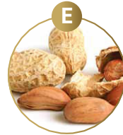
E ERDNÜSSE UND DARAUS GEWONNENE ERZEUGNISSE