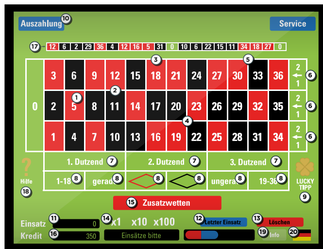
Esempio di American Roulette. Fare attenzione che l'aspetto e la disposizione degli elementi operativi possono subire modifiche.

Se avete domande, premete semplicemente il tasto Info oppure rivolgetevi ai nostri collaboratori che saranno lieti di aiutarvi.